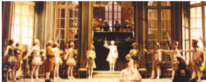
Le Chevalier à la rose/Strauss