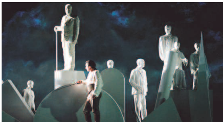
Don Giovanni/W.A. Mozart

Toulouse a une vraie passion pour l'art lyrique ; dans les années trente, le public toulousain faisait ou défaisait des carrières au gré de son humeur. De grands chanteurs ont fait leurs premières armes sur la scène du Théâtre du Capitole : Roberto Alagna, Leontina Vaduva... Cette grande maison est une des rares en France qui possède encore des ateliers de costumiers, de perruquiers... En partenariat avec le Théâtre du Capitole, la Bibliothèque Saint-Cyprien se propose de vous faire découvrir l'envers du décor : l'élaboration des costumes de l'ébauche à leur réalisation, des éléments de décors, des accessoires... Laissez vous guider et entrez dans la magie de l'opéra.