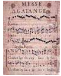
Messe Agatange. XIIème siècle (Rés. Mus. B 59)