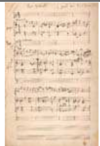
Déodat de Séverac. Partition pour orgue et violoncelle. Fin XIXème siècle (Ms 2642 [3] )

La collection comporte également des manuscrits autographes de personnalités comme Déodat de Séverac, Salvayre ou Büsser, des motets et oratorios de Combes, de Marty, le "Ballet de l'inconstance" de Chavigny sur des poèmes du toulousain Baour-Lormain de Berjaud.