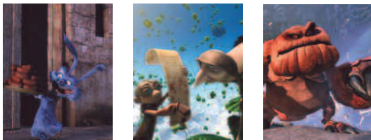
Chasseurs de Dragons © MMVII Futurikon Films, Trixter, LuxAnimation, France 3 Cinéma, RTL-TVi, en coproduction avec MacGuff Ligne.

Pour toute information complémentaire, vous pouvez contacter le pôle L'œil et la lettre de la Médiathèque José Cabanis (accessibilite.bibliotheque@mairie-toulouse.fr)